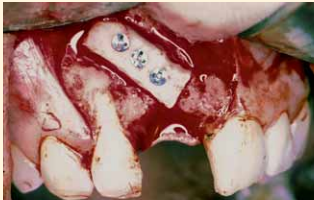
Se realizan pequeñas perforaciones de la cortical del lecho receptor hasta alcanzar la medula ósea y producir sangrado. Adaptación del injerto monocortical de mentón al defecto y fijación rígida del mismo mediante tres tornillos de osteosíntesis. Se redondean los bordes del injerto para evitar decúbitos en el colgajo durante el periodo de cicatrización.