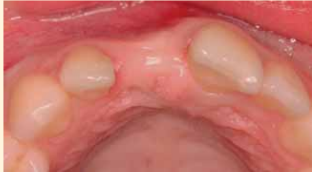
La visión oclusal muestra una atrofia del reborde alveolar, en la región de la exodoncia. La radiografía muestra un defecto óseo residual. Se planifica la reconstrucción previa del proceso alveolar mediante un injerto óseo autógeno de mentón e injertos conectivos.