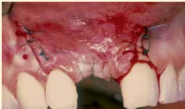
Se realiza un corte en el periostio de la base del colgajo, para permitir su reposición pasiva y un cierre sin tensión. Sutura con monofilamento de 5 ceros (nylon). A los 10 días se retiran los puntos y la paciente llevará, de nuevo, una prótesis provisional adherida tipo Maryland (es mejor utilizar prótesis dentosoportadas en pacientes con injertos monocorticales para evitar dehiscencias del colgajo y la exposición del injerto).