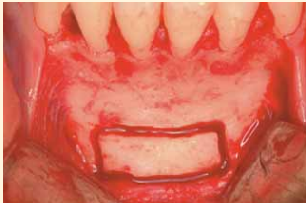
Toma del injerto de mentón. Incisión intrasulcular con dos descargas verticales a nivel de los caninos. Despegamiento mucoperióstico y tallado del injerto de mentón con fresa de fisura, 5 mm por debajo de los ápices de los incisivos inferiores.