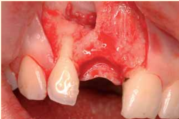
Se repite la incisión anterior, para no agregar nuevas cicatrices. Despegamiento mucoperióstico. Eliminación del tejido cicatricial que rellenaba el defecto óseo residual.