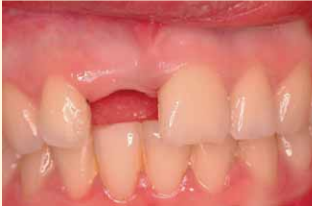
Aspecto a los cuatro meses de la intervención. La paciente ha llevado provisionalmente una prótesis adherida tipo Maryland. Se planifica la rehabilitación del espacio edéntulo con un implante.